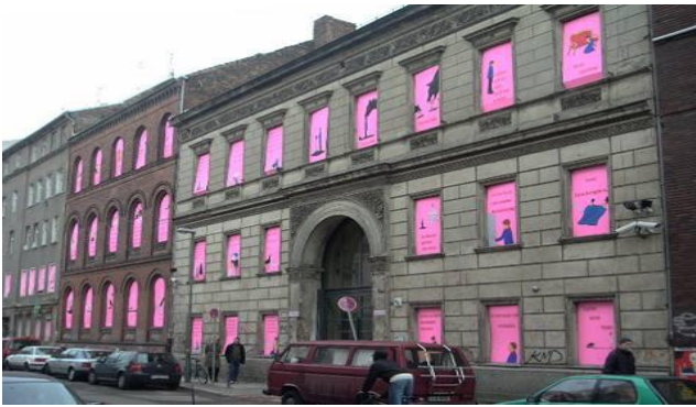
『Signs of Memory』ドイツ・ベルリンにて