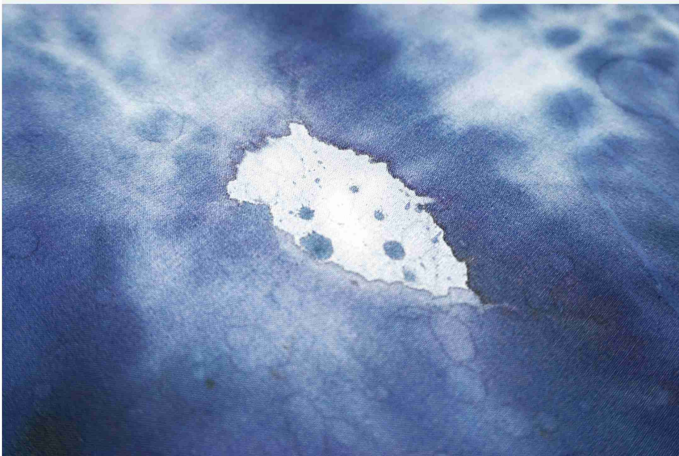
Aiko YAMAMOTO Solo Exhibition "Mountain puddle"

2018.8.17 [Fri] -10.21[Sun] @Old warehouse DAIMARU